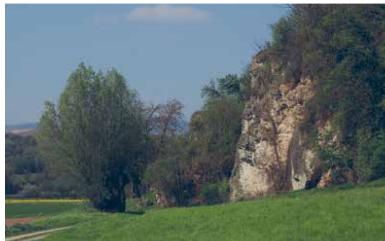
Fels am Jestädter Weinberg

Im östlichen Teil des Gebietes gelegene, gut besonnte Tümpel mit ausgeprägtem Ufer- und Unterwasserbewuchs bieten Lebensraum für den Kammolch , die größte heimische Molchart. Die Männchen werden 12-16 cm groß, die Weibchen bis zu 18 cm. Nordwestlich der Tümpel liegt ein ganzjährig wasserführendes Sumpfbiotop mit Schilfröhricht , das spezialisierten Röhrichtbewohnern wie Rohrammer und Teichrohrsänger als Brutplatz dient.