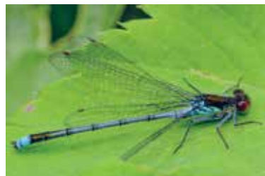
Großes Granatauge

Unsere Tour führt an beeindruckenden bewaldeten Steilhängen dieses FFH-Gebietes vorbei. So findet man hinter Albugen auf der östlichen Seite die Laubwälder an der Uhlenkuppe und hinter Werleshausen östlich des staudenreichen Werraufers Traubeneichenwälder entlang des Harthberges.