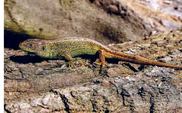
Zauneidechse, Foto: Kathy Büscher/Flickr(CC BY-NC-ND 2.0)

geordnet und sind umsäumt von Erlen-Eschen- und Weichholzauenwäldern . Diese sind aus der forstlichen Nutzung herausgenommen, so dass sich der Auenwald durch eine Vielzahl von stehendem und liegendem Totholz sowie Höhlenbäumen auszeichnet. Das Gewässer ist Rast-, Nahrungs- und Brutbiotop für zahlreiche Vogelarten, z.B. Bekassine , Beutelmeise und Wasserralle . Weiterhin sind eine Vielzahl von Libellenarten wie das Große Granatauge und der Frühe Schilfjäger – früher Kleine Mosaikjungfer genannt – anzutreffen.