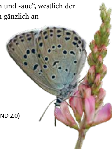
Thymian-Ameisenbläuling, Foto: xulescu_g/Flickr(CC BY-NC-ND 2.0)

Das Teilgebiet „Werraaltarm und -aue“, westlich der Bahnlinie gelegen, hat einen gänzlich anderen Charakter. Der Werraaltarm und die ehemaligen Kiesseen werden dem Lebensraum Natürliche nährstoffreiche Stillgewässer zu-