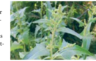
Glanz-Melde