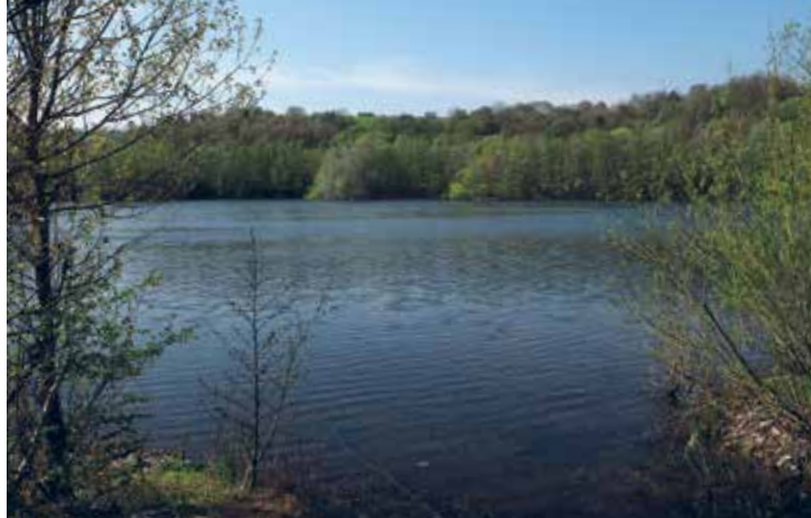
Werraaltarm bei Albugen, Foto: Rainer Gilbert